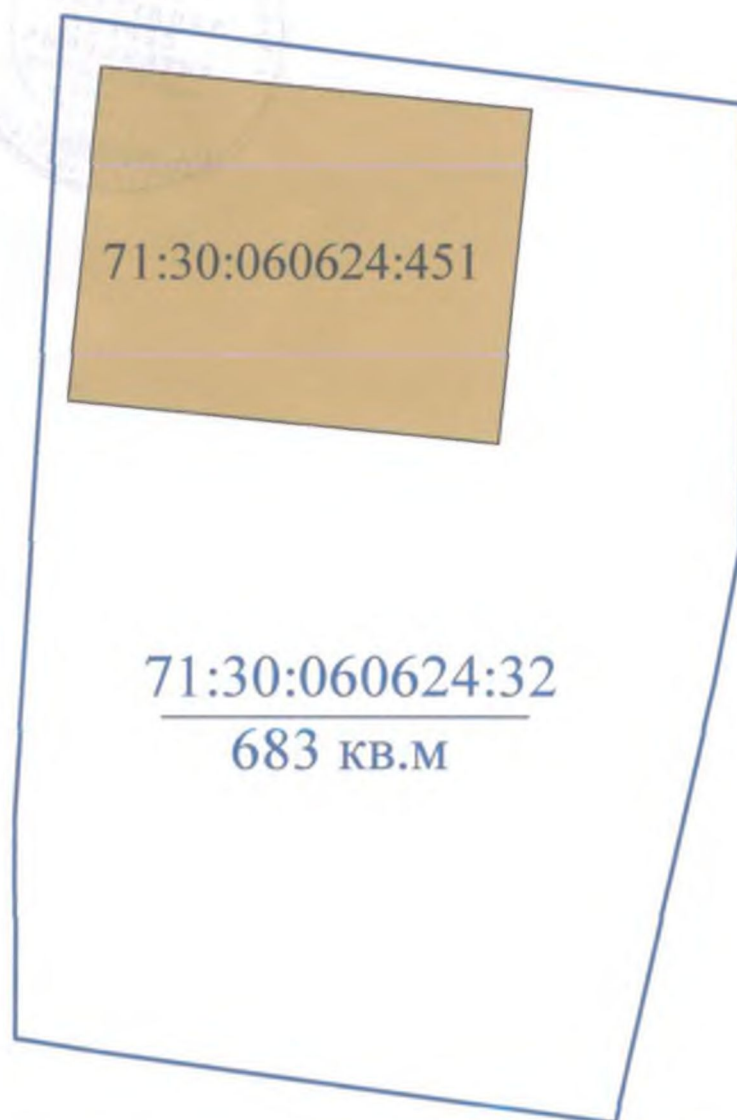
Схема планировочной организации земельного участка